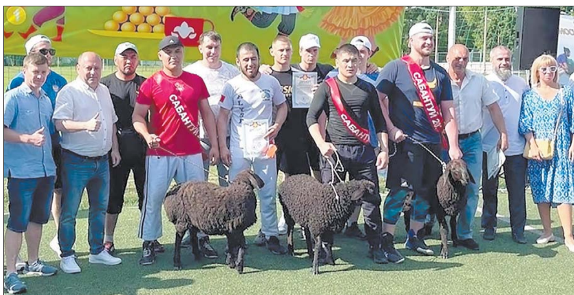
Главная задача праздника - укрепить добрососедские отношения, способствовать взаимному познанию и культурному обогащению народов.

Событие. В Воскресенске отпраздновали татарский национальный праздник