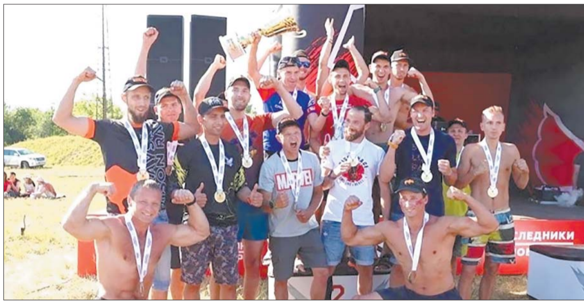
В гонке, которая прошла на полигоне «Алабино», приняли участие 75 команд.

Спорт. Патриотический забег для молодежи и волонтеров Подмосковья «Наследники Победы» собрал 1500 участников