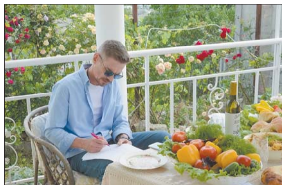
Кадры из сериала.

Премьера сериала «Бим-2» состоится на телеканале НТВ.