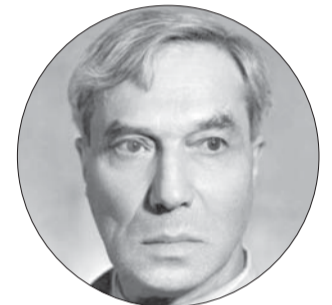
Борис ПАСТЕРНАК, советский поэт