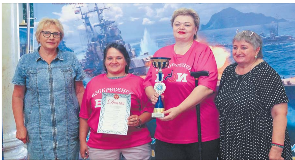
Воскресенская команда заняла в игре второе место.

«Морские бои» длились четыре часа. По завершению каждого тура волонтеры предоставляли протоколы игры для подсчета очков главному секретарю игры, представителю уполномоченного по правам человека