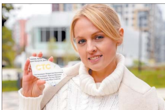
Кадры со съемочной площадки сериала.

Телеканал СТС совместно с Art Pictures Vision и Black Box Production запустили съемку комедийного сериала «Кибер Иван» про актера-неудачника, вынужденного изображать робота-прислугу.