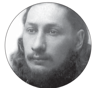
Павел Флоренский, православный богослов

Мои милые, грех, который особенно тяжело было бы мне видеть в вас, - это зависть. Не завидуйте, мои дорогие, никому.