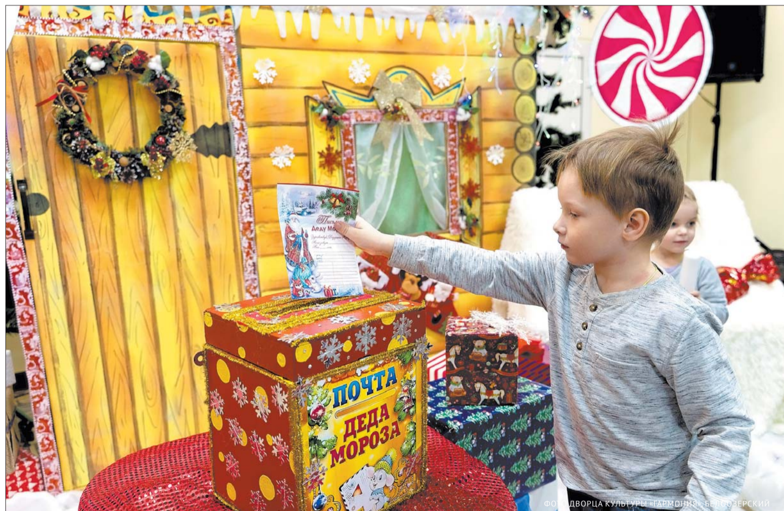
ФОТО ДВОРЦА КУЛЬТУРЫ «ГАРМОНИЯ», БЕЛОЗЕРСКИЙ

Праздник. Юные воскресенцы весело отпраздновали день рождения главного символа Нового года / 6