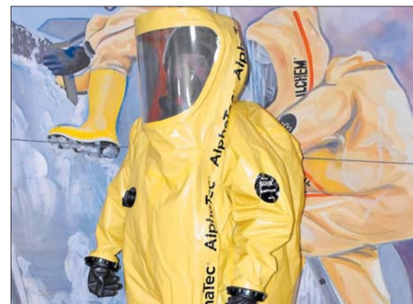
Эта служба и опасна, и трудна.