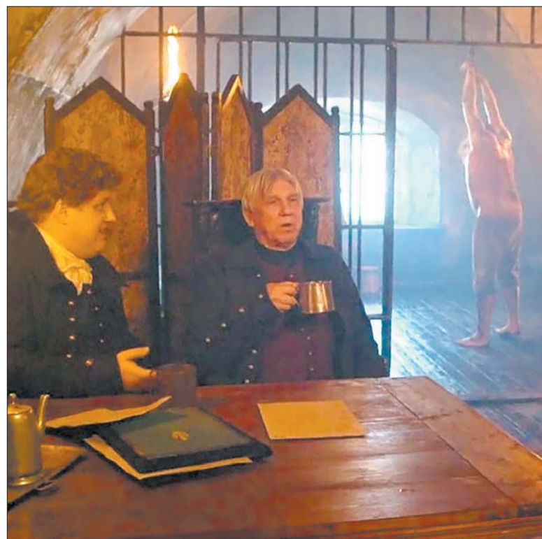
Кадры со съемочной площадки сериала.