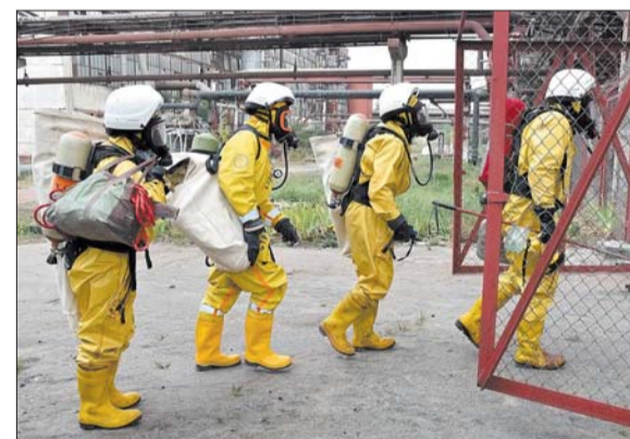
Быстро собраться по тревоге - для спасателей «ВМУ» дело чести.