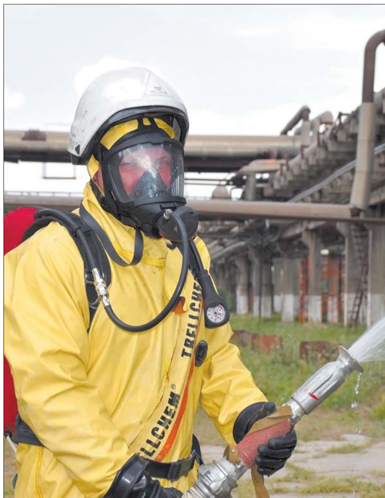
Спасатели всегда начеку и готовы прийти на помощь.

Но газоспасатели знают, как спасти людей, здоровью и жизни которых угрожают опасности другого рода – падения с высоты, термические и химические ожоги и любые другие напасти – вплоть до ДТП на территории завода.