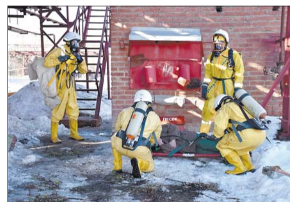
Тяжело в учении, легко в бою.