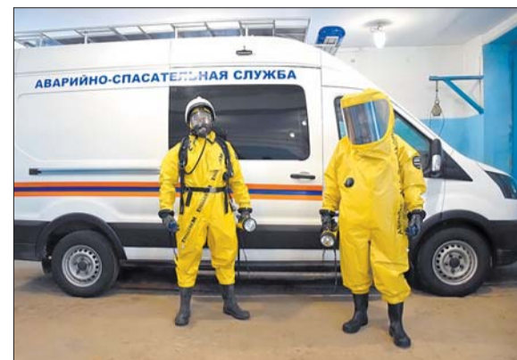
Газоспасательный отряд «ВМУ» перед выездом на задание.