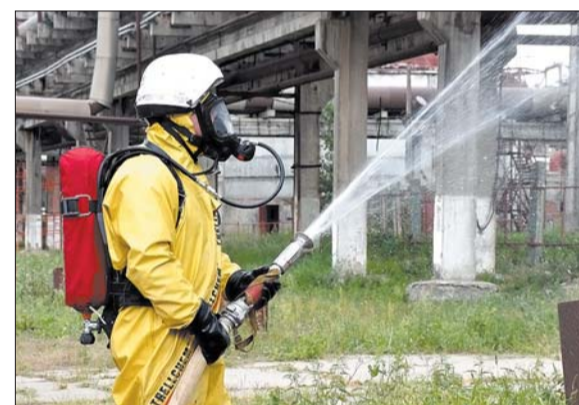
Сотрудники отряда регулярно проводят учебные тревоги на предприятии.