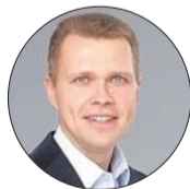
Никита Чаплин, депутат Государственной думы

Желаю, чтобы 2023 год подарил нам исполнение всего задуманного. Пусть год принесет благополучие и укрепит веру в собственные силы! Здоровья, успехов, счастья вам и вашим близким!