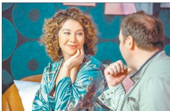
Кадры со съемочной площадки сериала.

Создатели проекта вдохновлялись «Ворониными», поэтому первым в новый сериал пригласили звезду хита «СТС» Георгия Дронова. Актер отметил, что получает удовольствие от съемок в проекте, при этом не скрывал опасений, что искусственный интеллект может лишиться его работы: «А вдруг произойдет так, что роботы вытеснят нас, представителей человечества? Продюсеру ведь так намного удобнее: купил программу, запустил ее и работаешь. Актеры-роботы не капризничают, кормить их не надо, да и рабочий день у них может быть по двенадцать часов в сутки...»