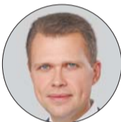
Никита Чаплин, депутат Государственной думы РФ:

Более 40 лет в последнее воскресенье мая в нашей стране отмечается День химика. Официально он был установлен в 1980 году. Сегодня, в преддверии профессионального праздника химиков поздравляют коллеги, партнеры и друзья.