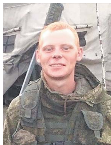
Никита Волков