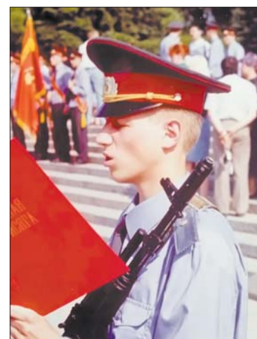
Анатолий Перехожих