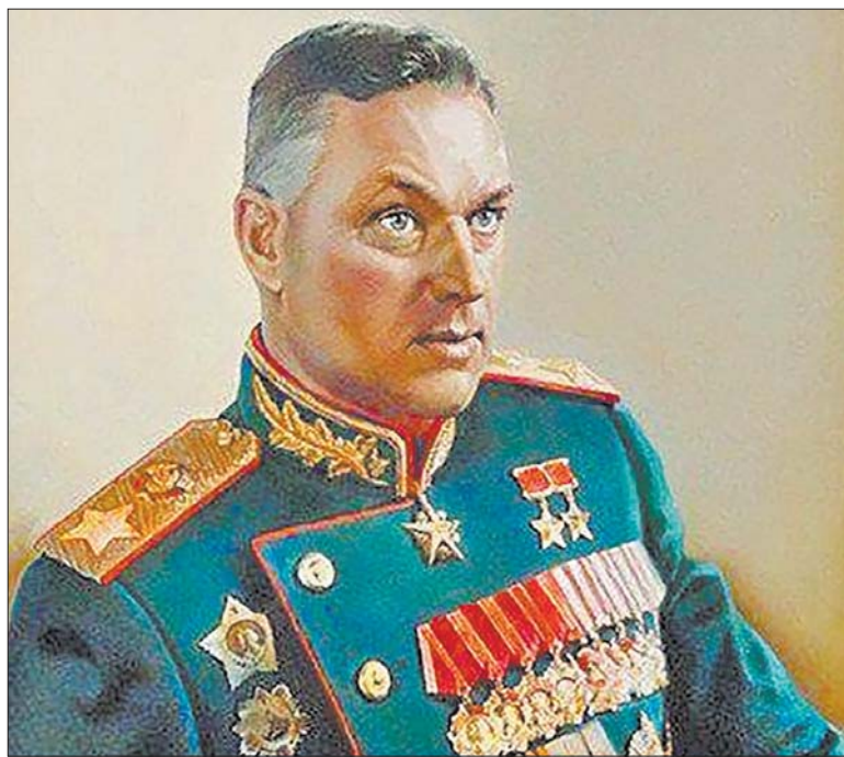
Константин Рокоссовский в парадном мундире