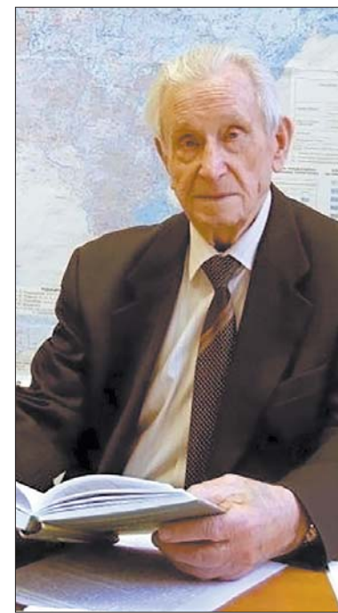
Лауреат Государственной премии Александр Каштанов