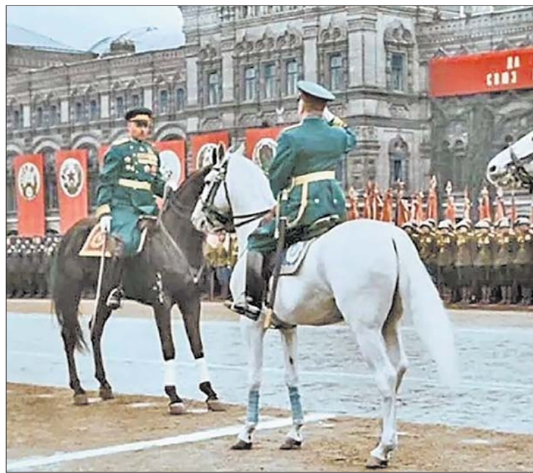
На Параде Победы в 1945 году маршалы Рокоссовский (слева) и Жуков