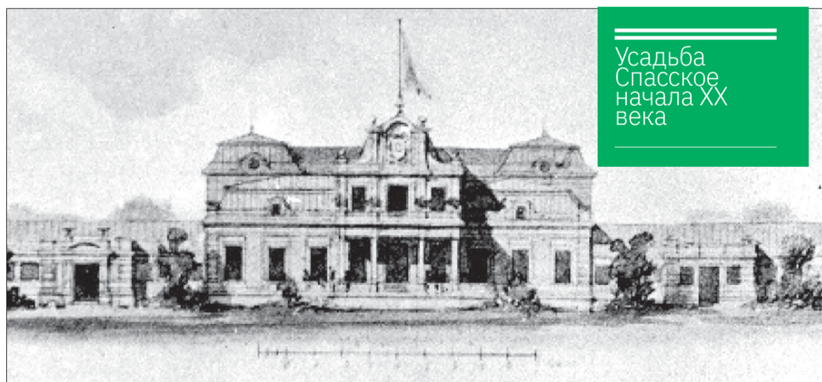
Усадьба Спасское начала XX века

Одним из желанных гостей стал Николай Васильевич Гоголь. Он приехал в Спасское со своим братом летом 1851 года и плодотворно работал здесь над вторым томом романа «Мертвые души». Брат Гоголя оставил воспоминания о месте, где в будущем вырастет город Воскресенск: «Подмосковная деревня, в которой мы поселились на целый месяц, очень понравилась Гоголю. Все время, которое он прожил, он был необыкновенно бодр, здоров и доволен. Дом прекрасной архитектуры, построенный по планам Растрелли, расположен на горе; два флигеля того же вкуса соединяются с домом галереями, с цветами и деревьями; посреди дома круглая зала с обширным балконом, окруженным легкой колоннадой. Направо от дома стриженный французский сад