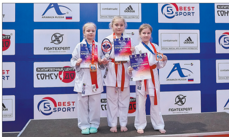
Воспитанники спортивной школы по единоборствам в составе сборной Московской области показали достойный

«За счет большого количества участников и широкой географии турнира конкуренция во всех категориях была очень плотной. В каждом поединке нужно было отработать на 100 процентов!