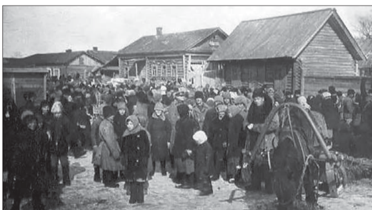
Станция Воскресенск в годы ВОВ

Невероятный случай произошел 8 февраля 1945 года: с острова Узедом в Балтийском море совершили побег десять советских военнопленных под руководством летчика Михаила Девятаева. Они смогли угнать бомбардировщик Heinkel, хотя его конструкция была совершенно незнакомой. Как выяснилось, на бомбардировщике стояла секретная аппаратура, предназначенная для испытаний ракет «Фау-2». Аппаратурой заинтересовался конструктор советской ракетной техники Сергей Павлович Королев. По его ходатайству летчика Михаила Девятаева удостоили